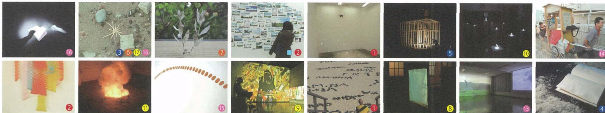
※作品は画像のイメージと異なることがあります

本企画展は、若手芸術家の創作活動を支援するとともに、地域の人々との交流を通じて文化芸術による地域の活性化を目的とし、2009年から始まったプログラムである「小豆島アーティスト・イン・レジデンス」滞在アーティストによる第3回の成果発表会に併せて、東京芸術大学の教員、大学院生等が行う地域と連携した芸術プロジェクトです。テーマは、小豆島地域における環境や歴史、生活と芸術がコミュニケーションしながら制作していく新しい芸術の試みです。様々な町民の参加と、アーティストのコミュニケーションの中から作品が制作され展示されます。展覧会会期中に、作品を見ながら新しい島の景観を発見していけるアートラインツアーを創出するものです。