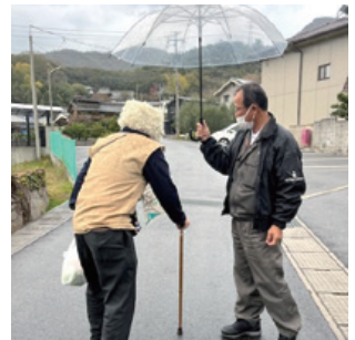
温かい声かけに、とても優しい気持ちになりました

※安全な保護のため、行方不明が発生した際は迷わず、小豆警察署(☎82-0110)にご連絡ください。