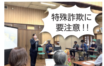
小豆警察署職員から詐欺被害防止を呼びかけました

昨年末のこまめカフェでは、小豆警察署職員による「詐欺被害」と「交通事故」防止の勉強会を行いました。詐欺は、島内でも件数が増加しており、「怪しい電話には落ち着いて対応し、不安な時は小豆警察署か相談窓口ご連絡を」と教わりました。また、交通事故は「夜間が特に注意が必要」で、反射板等の積極的な使用が有効であることも学びました。