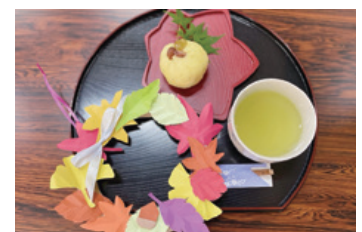
カフェでは手作りお菓子のおもてなしもあり、認知症の方々が活躍しています