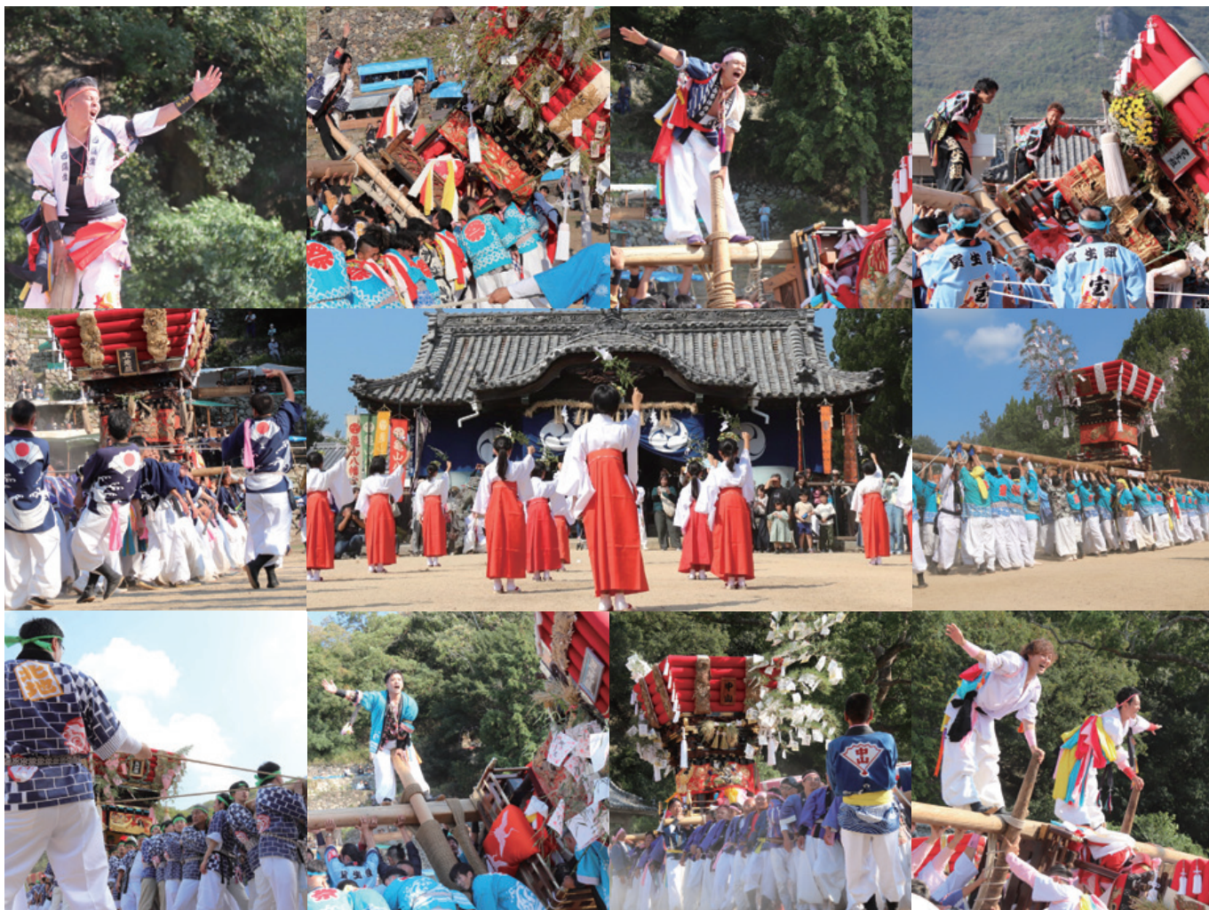
10月11日に福田地区、15日に内海地区、16日に池田地区において、それぞれ秋祭り太鼓台奉納が行われました。 4年ぶりの“制限のない”秋祭りには、多くの見物客も訪れ、町に活気が満ちあふれた3日間となりました。