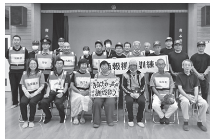
【訓練に参加した皆さん】

近年の行方不明の発生状況について、〇×クイズなどで分かりやすく学び、行方不明になった際の通報の重要性を再確認しました。