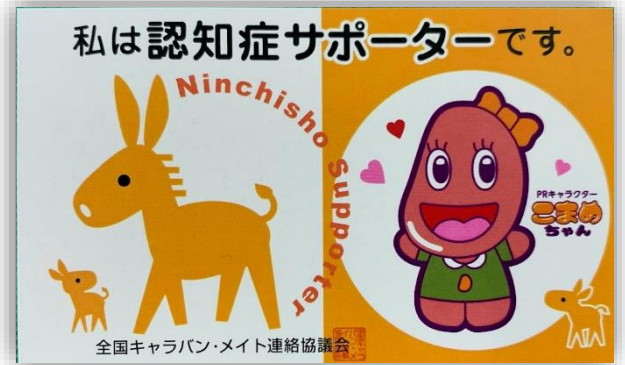
【認知症サポーターカード】

何か特別な事をする人ではありません。 認知症を正しく理解し、 認知症の方やその家族を温かく見守る応援者です。 子供から大人まで、誰でもなる事ができます☆☆