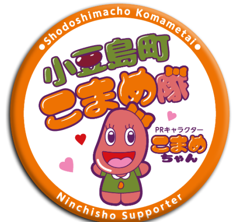
【小豆島町こまめ隊バッジ(実物大)】

→こまめな声掛け・こまめな見守り・こまめな連携を三原則に日常生活の中で自分ができる範囲の支え愛活動を行う方です。