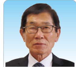
議員 羽田 満 (69)