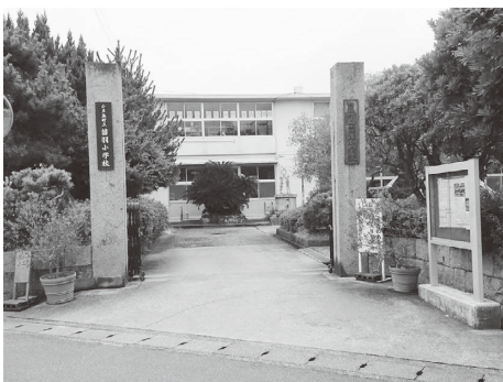
小豆島ならではの特色ある教育を

水泳練習のほか、縦割り班活動などにも取り組み、特に苗羽小学校の音楽部は70年を超える伝統がある。