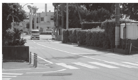
拡幅が待たれる国道436号