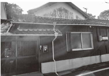
移住体験施設として整備される黒島邸（馬木）