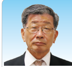
議員 高橋 淳 (74)