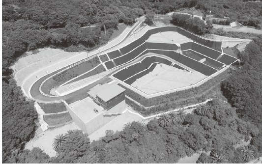
完成した一般廃棄物最終処分場

一般廃棄物最終処分場整備事業の総事業費が減額となったことに伴い、令和元年度に国から概算で一括交付された交付金を返還するものです。