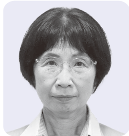
なべたに まゆみ 議員 鍋谷 真由美