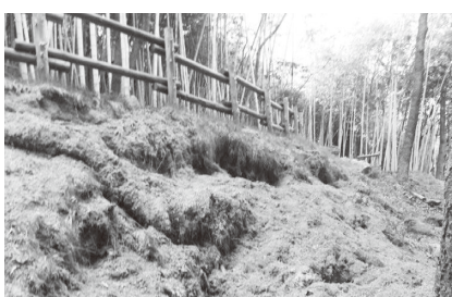
イノシシに掘り荒らされた遊歩道の斜面