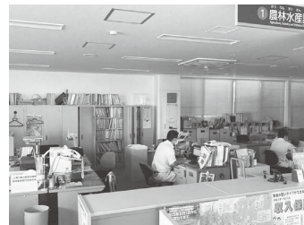
庁舎でも節電を実施(昼休み時の消灯)