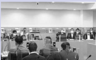
全員協議会の様子