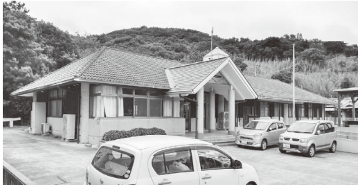
グループホーム「ソレイユ」(二面)

【質問】 当然ながら町の財産の活用も視野に入れ、福祉法人や土庄町との情報交換を密にして整備に努めたい。