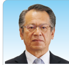
副議長 大下 淳 (65)