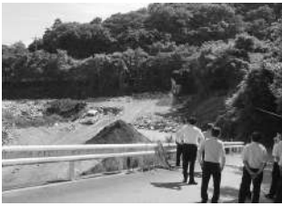
徳本処分地の現状