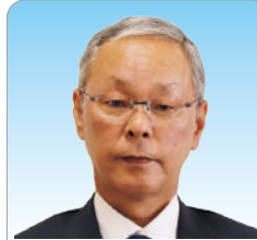
議員 高尾 豊弘 (52)