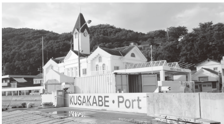
航路休止中の草壁港

間事業者が営利を目的として行う事業であつて町の権限に属さない事項であり、その存続の是非を住民投票で問うことは適切ではないため実施する考えはない。