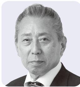
塩田 洋介 議員

町「地域産業の活性化、地方創生の推進に向けて、航路をはじめとする公共交通の充実が欠かせない重要な事であると考ええる」