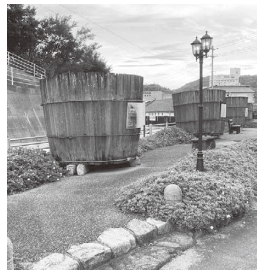
醬ポケットパーク(苗羽)