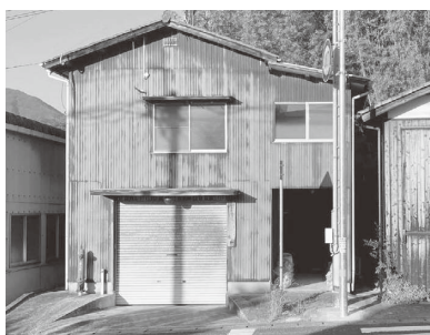
建築後40年以上経過した室生分団屯所