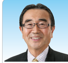
議員 中川 光秋 (75)