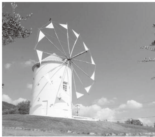
オリーブ公園のギリシャ風車

経年劣化に伴う風車の改修を行うとともに、夜型観光の推進に向け、ナイトコンテンツとしてライトアップ設備を整備するものです。