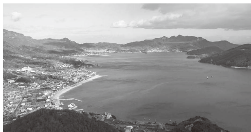
航路再開を待ち望む内海湾

問 我々は全力で航路再開に取り組み、町長にはリーダーシップを発揮され航路再開へのかじ取りを心から願うが、いかがか。 答 草壁航路を全く諦めると言ったことはない。草壁港がある限りチャンスはあるわけで、今はそのチャンスを待つ時期である。