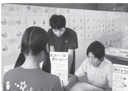
文化祭での生徒保健委員会の皆さんの活動

る野菜の摂取量を体感してもらえようというゲームをしたり、オリリーブの実やオイルと野菜を使った簡単に出来る料理レシピを紹介しました。食生活改善推進協議会の皆さんにも参加していただき、高校生にアドバイスをいただきました。卒業後も健康な生活が送れるように、今後も指導していきたいと思えますが、ご家庭でも、食生活について話す機会をつくっていただければありがたいです。