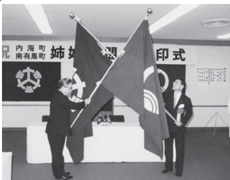
昭和58年の姉妹町盟約調印式の様子