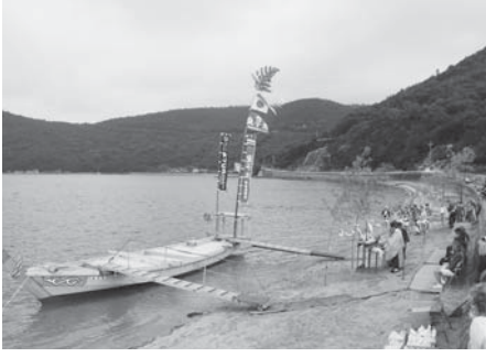
新「皇子丸」竣工式の様子

「皇子丸」は、昭和53年頃に、中古の木造漁船を改造したもので、建造から半世紀近くが経過し、老朽化が目立ってきたため、地元神浦をはじめ、小豆島町内外から多くの支援を受けて、