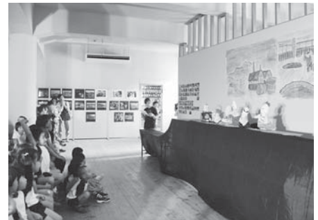
醤油を紹介した人形劇

その作品づくりに参加した島民の皆さんが、自主的に企画運営したのが、今日の「醤油会館まつり」です。今日は、草壁保育園園児も参加した音あそび、地元の方々による三味線や箏の演奏、醤油を紹介した人