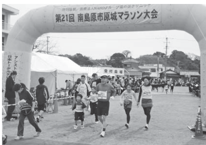
原城マラソンに参加する小豆島町の皆さん