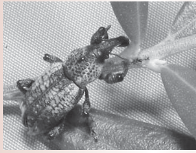
「オリーブアナアキゾウムシ」株元に集まりやすいので、除草を徹底しましょう