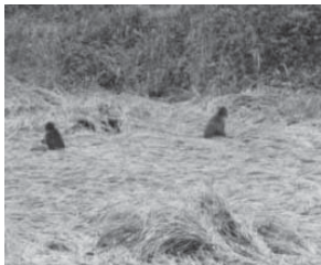
稲を食べる野生ニホンザル

サルが田畑を餌場と認識しないように、サルを見たら、花火・パチンコなどで、追い払うことが重要です。野生のサルは動物園の動物でもペットでも家畜でもありません。付き合い方をまちがえると、農作物被害とともに、ひっかかれる、かみつかれるなどケガにつながることもあります。サルを見たら必ず追い払いましょう。