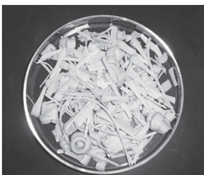
小豆島産業振興・環境技術会議

これらのことから、ふしの利用方法については更なる研究が必要とされています。これからは製麺業者の皆さんと協力し、ふし発生量の減少や、食材利用を含めた原料以外の利用方法についても研究を行っていきますので、よろしくお願