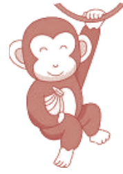
この野生ニホンザル、どこがおかしい？