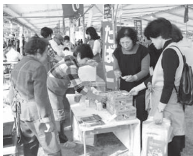
昨年のふるさと商工まつり

込書で10月1日(火)までにお申し込みください。小豆島町のHPからダウンロードも可能です。申し込み先 商工観光課 ☎82-7007