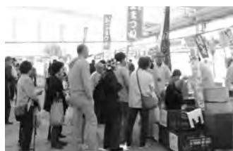
昨年のふるさと商工まつりのようす