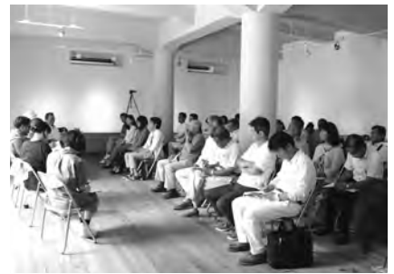
公開ミーティングが醬油会館で行われました

すぐ基本的なことですが、随分長い間、人々は、それぞれの地域の本来持っている魅力と可能性を、自分たち自身の知恵と力で、知恵と力をあわせて、磨いて、高めていくことを忘れていたように思います。田舎よりも都会が、地方よりも中央が、優れていると考え、都会と中央の考え方に従うことに慣れてしまっ