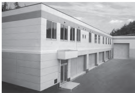
小豆島リサイクルセンター

資源ごみの日に出すことができない場合は、直接リサイクルセンターへ無料で持ち込みが可能ですので、ぜひご利用ください。ただし、持ち込みの際は事前に環境衛生課または池田窓口センターで手続きが必要です。