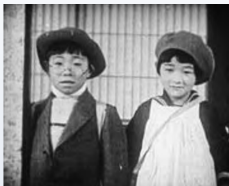
映画「私のパパさんママが好き」より

小豆島町では、ご夫妻を顕彰し、数々のドラマの舞台となった小豆島から映像作品の素晴らしさを国内外に発信するため、下記のとおり第1回の記念事業を開催します。