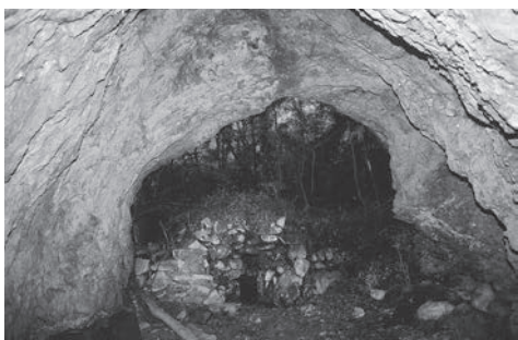
ほら貝岩洞穴遺跡

※この遺跡に行くためには、石門洞へあがる途中にあるマイクローバス駐車場から山中に入ります。藪の中を進むため、行かれる方は注意が必要です。