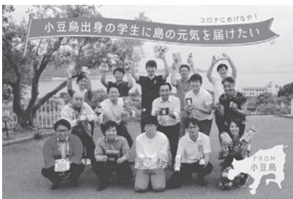
小豆島キッチンのメンバー

目標金額100万円を超え、なんと150万円を超えた。支援総額が目標を大きく上回ったことで、支援対象を、小豆島町奨学資金の貸付を受けている学生に加え、土庄町奨学資金の貸付を受けている学生まで広げることができました。このギフトを受け取った学生の皆さんが、故郷の味で元気をだして、勉強に励み、次世代の島の担い手となることを願っています。