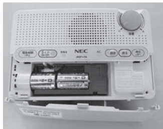
電池交換は、前面のふたを取り外して行ってください。