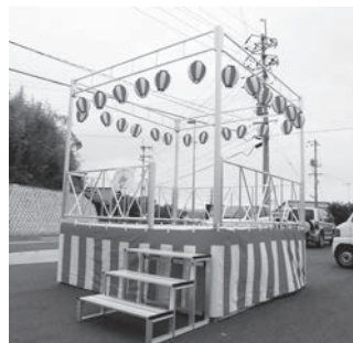
入部自治会のやぐら