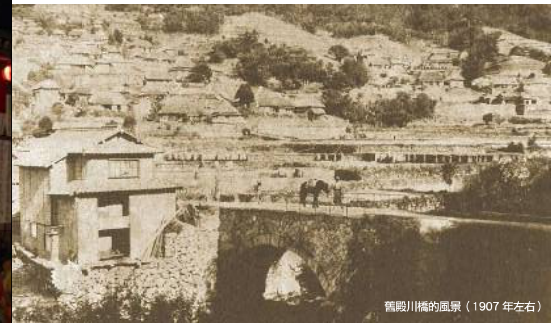
觀殿川橋的風景（1907年左右）