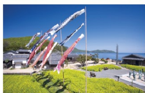
◎二十四の瞳映画村