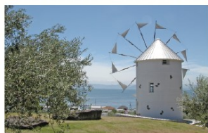
◎道の駅 小豆島オリーブ公園