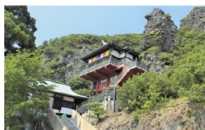
◎小豆島八十八ヶ所霊場めぐり