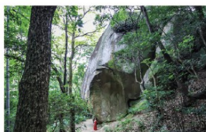
◎大坂城石垣石丁場跡