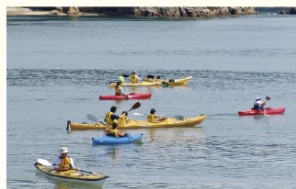
◎道の駅・海の駅 小豆島ふるさと村