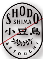
シャドウをつけた 表現