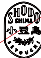
アウトライン 表現